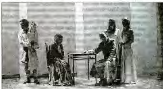
Une pièce à découvrir jusqu'au 20 décembre ainsi que les 30 et 31 décembre

A voir jusqu'au 20 décembre au théâtre de l'Iris : du mercredi au samedi à 20 heures, sans oublier les soirées spéciales Nouvel An les 30 et 31 décembre à 20 heures. Réservations prudentes à l'Iris, 331 rue Francis-de-Provençolo, Tél. : 04 78 68 86 40